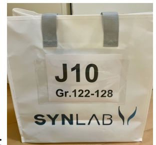
Noch besser so: